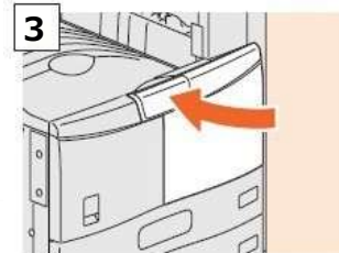
3 カバーを閉めてください