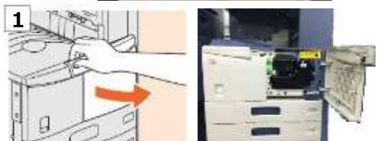
1 前面カバーを開けます