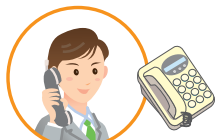
特定番号通知機能ご契約者さま

誤って、着信課金等サービスの番号(0120等)を発信元番号として設定したり、特定番号通知の契約のない番号を発信元番号として設定しないでください。